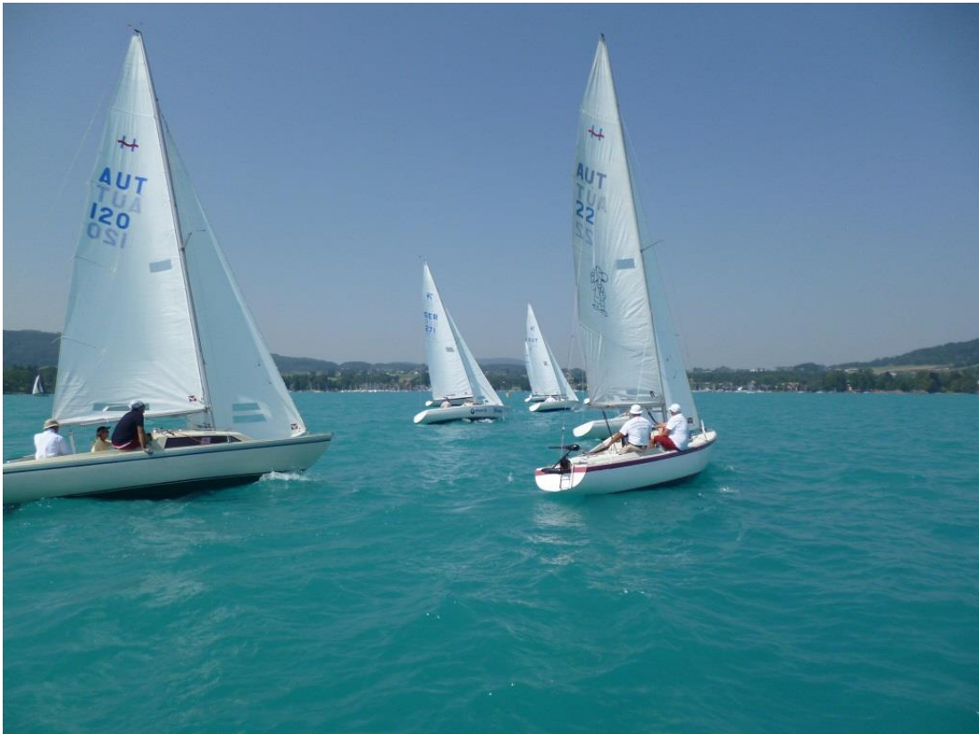
H-Boot Clubmeisterschaft 2015 im UYCA

Alle Bilder honorarfrei für die Tagespresse. Im Anhang finden Sie die Bilder in Originalgröße.